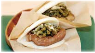
台湾式角煮入りバーガー